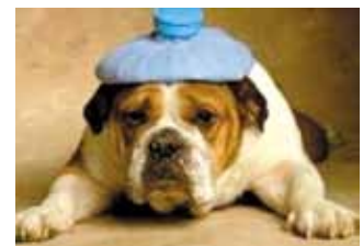
Sintomas de IVAS por mais de 7 a 10 dias, rinorréia purulenta, tosse persistente,